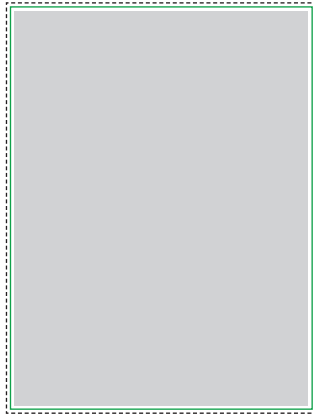
1:10 Vorlage auf Seite 2